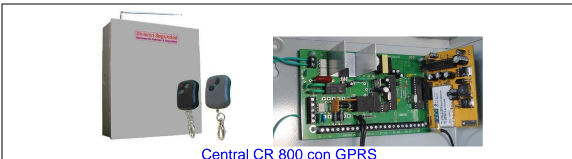
Central CR 800 con GPRS

Cuando se presentan casos en donde no hay línea telefónica fija o se desea una mayor seguridad en cuanto a la comunicación, las centrales inalámbricas, además del comunicador telefónico por línea fija, tienen un sistema de comunicación llamado GPRS (del inglés: General Packet Radio Service). Este sistema es como si fuera un teléfono celular pero sin teclado. Actúa como una línea telefónica celular, permite la comunicación de la central de alarma con el propietario a través de un chip de cualquier compañía, que puede ser de la modalidad "con tarjeta" o con abono fijo. La central se programa para reportar eventos y éstos pueden enviarse mediante grabaciones de voz o por mensajes de texto (SMS). También, la central puede recibir mensajes SMS de comando, como para activar, desactivar, pánico, encendido de luces, etc.